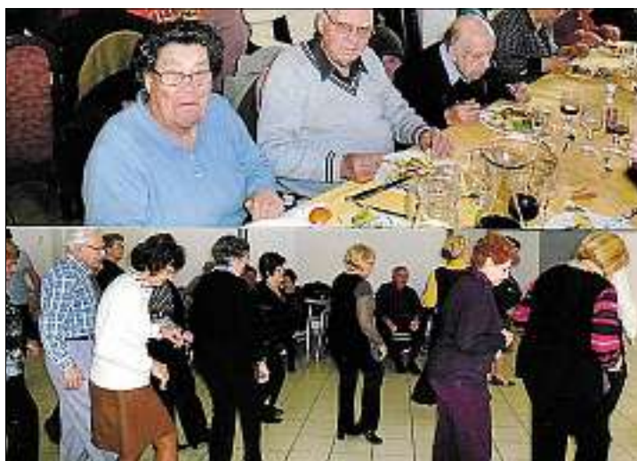
Ils s'en sont donné à cœur joie.

C'est au Mas Blanc, centre de vacances à Alénya, que 70 membres de la Fnaca locale ont partagé un bon repas suivi d'un après-midi dansant. Leurs amis des comités d'Alénya, Saint-Cyprien et Cabestany, les avaient rejoints. L'occasion pour tous d'oublier les soucis le temps d'une journée. La bonne humeur était de mise et de nombreux danseurs se sont fait plaisir sur la piste. A l'heure des adieux, tous ont émis le souhait de se retrouver au plus vite, afin de partager de nouveau un bon moment de convivialité.