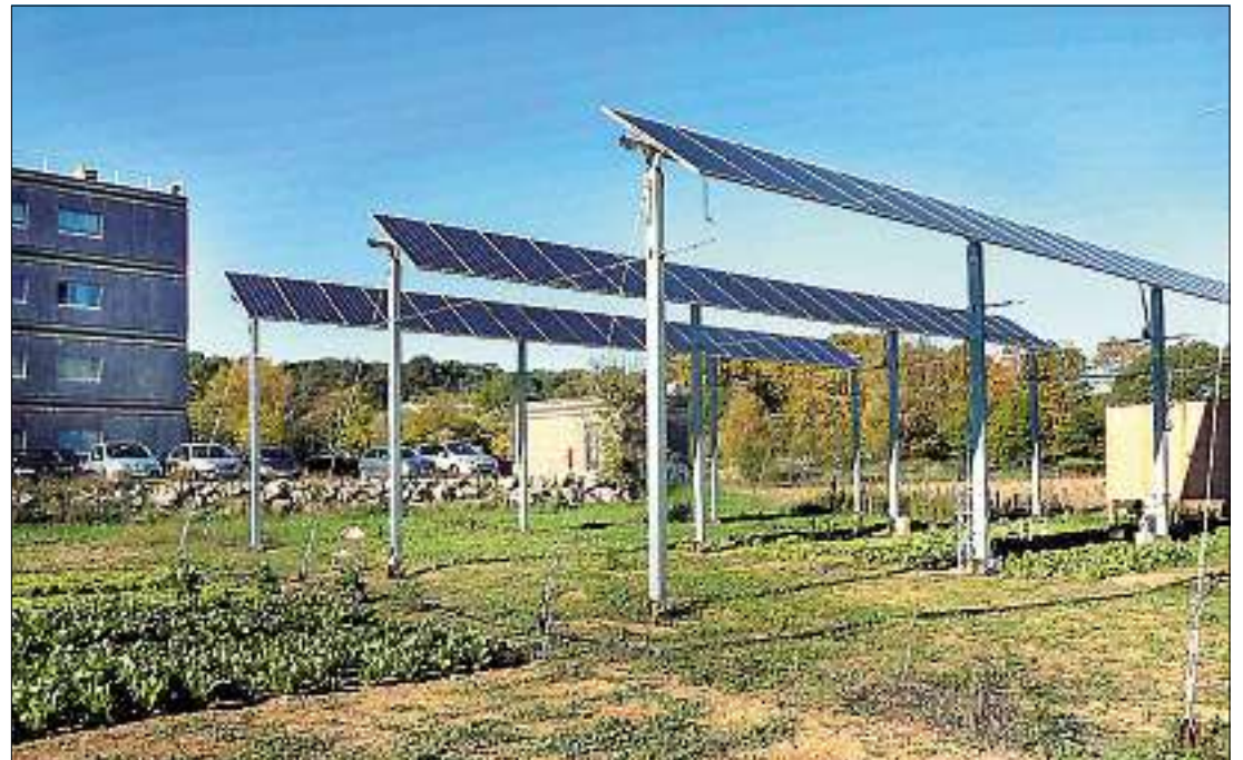
Des panneaux solaires pivotants vont être installés sur 4 ha de vigne, les pieds seront ainsi protégés des ardeurs du soleil de l'été.